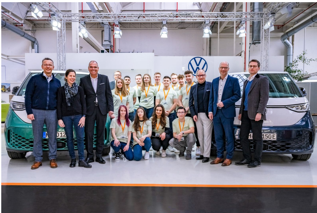
Das Projektteam vor dem neuen ID.Buzz 1 und dem neuen ID.Buzz Cargo 2